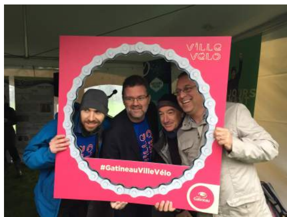
Déjeuner de lancement du Mois du vélo à Gatineau (1er mai 2017)

Une quarantaine de clubs, d'organismes, d'entreprises et d'institutions ont été contactés afin de contribuer au calendrier vélo. Le calendrier a réussi à rassembler 56 activités vélo pour le mois de mai 2017. Les activités affichées au calendrier ont été divisées en trois catégories, soit les activités sportives et sorties récréatives, les activités dans les organisations et institutions et les activités grand public et communautaires.