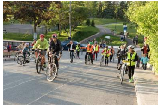
Course de la lenteur dans le cadre du Mois du vélo 2017

Cette septième année d'activités marque la première année du plan d'affaires triennal 2017-2020 de MOBI-O. Ce dernier découle d'un travail réalisé par les membres de l'équipe et le conseil d'administration sur la planification stratégique de l'organisme. Bien que l'équipe de MOBI-O ait connu des départs, l'organisme a su à nouveau démontrer sa stabilité, son professionnalisme et son efficacité pour atteindre les objectifs des projets et des mandats. Les mandataires sont toujours aussi satisfaits des services de MOBI-O et sont prêts à poursuivre les collaborations pour 2018-2019.