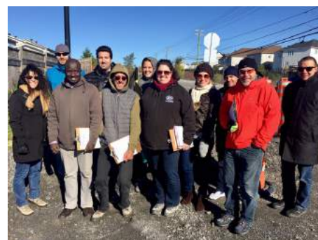
Groupe de marche pour le Plan local de déplacement du quartier Vieux Moulin

Au-delà des mandats en cours de réalisation ainsi que des projets récurrents pour 2018-2019, MOBI-O travaille activement au développement de partenariats prometteurs. Les liens entre ces partenaires et l'organisation ont d'ailleurs été renforcés au travers des années.