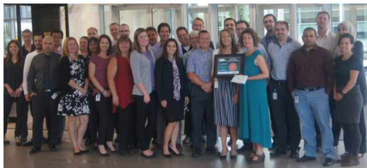
Remise de prix à la grande organisation gagnante du Défi sans auto solo 2017 : Énergie Renouvelable Brookfields