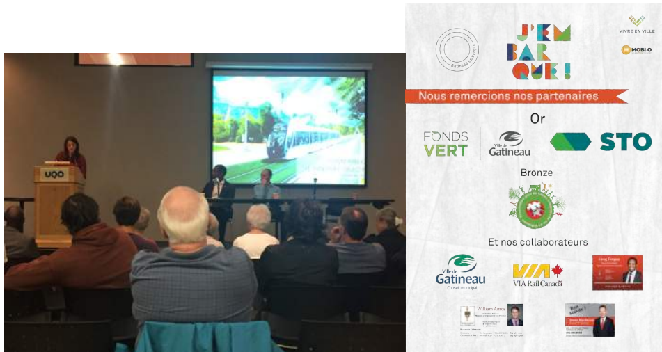
Forum sur les transports collectifs avec monsieur Greg Fergus (28 septembre 2017) et affiche officielle de la campagne

programmation diversifiée et a réuni plusieurs acteurs de notre collectivité autour des enjeux de la mobilité durable.