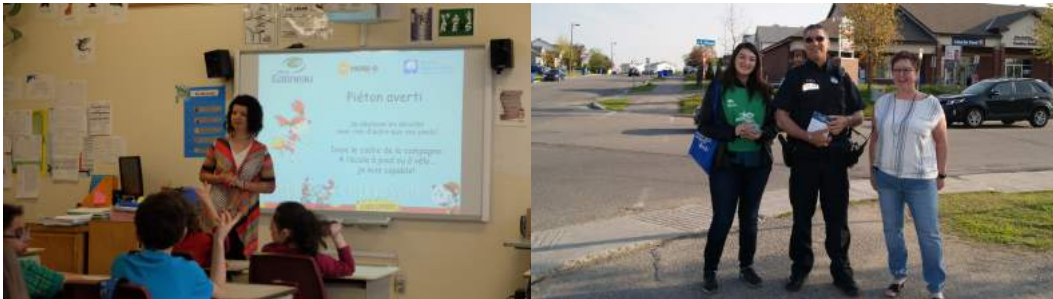
Piéton averti (avril 2017) et journée de sensibilisation (mai 2017)

Dans cette belle lancée, MOBI-O poursuit ses efforts pour assurer le déploiement du projet et l'atteinte des objectifs restants pour les 3 prochaines années à venir.