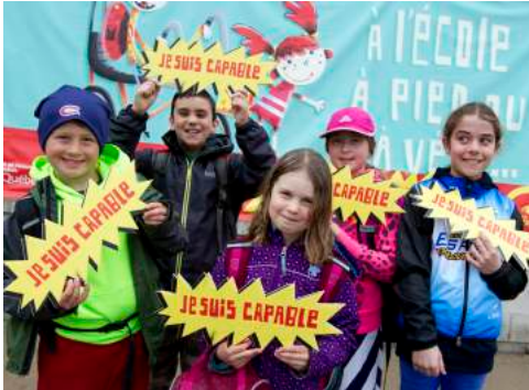
À l'école à pied ou à vélo, je suis capable !

Ce rapport d'activités dresse le bilan des activités réalisées par MOBI-O au cours de la période du 1er avril 2017 au 31 mars 2018. Cette année a été marquée entre autres par le développement d'un projet d'envergure À l'école à pied ou à vélo, je suis capable ! Celui-ci a par ailleurs permis à l'organisation de développer ses partenariats avec plusieurs parties prenantes du milieu scolaire et ainsi de créer des opportunités de nouveaux projets et mandats.