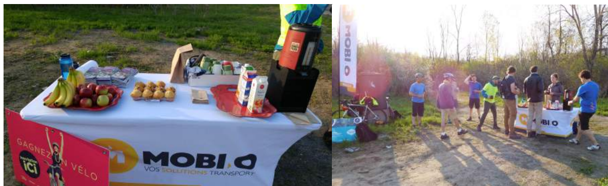
Déjeuners satellites d'Option vélo (mai 2017)

Sur la même formule qu'en 2016, les inscriptions à Option vélo 2017 ont été lancées à l'occasion du Mois du vélo 2017 ainsi qu'un concours visant la promotion du projet. Près de 1000 participants se sont inscrits en mai 2017. Aussi, des déjeuners satellites organisés une fois par semaine pendant le mois de mai sur des pistes cyclables achalandées ont permis de rejoindre directement de nombreux cyclistes ainsi que d'augmenter la visibilité du Mois du vélo et d'Option vélo.