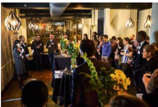
5@7 des partenaires de MOBI-O

Cette septième année d'activités marque la première année du plan d'affaires triennal 2017-2020 de MOBI-O. Ce dernier découle d'un travail réalisé par les membres de l'équipe et le conseil d'administration sur la planification stratégique de l'organisme. Bien que l'équipe de MOBI-O ait connu des départs, l'organisme a su à nouveau démontrer sa stabilité, son professionnalisme et son efficacité pour atteindre les objectifs des projets et des mandats. Les mandataires sont toujours aussi satisfaits des services de MOBI-O et sont prêts à poursuivre les collaborations pour 2018-2019.